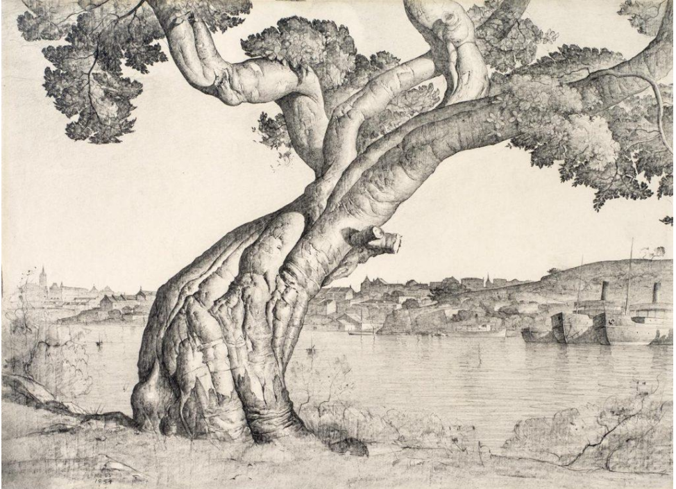
Port Jackson Vijgenboom, getekend door Lloyd Rees (1895-1988)